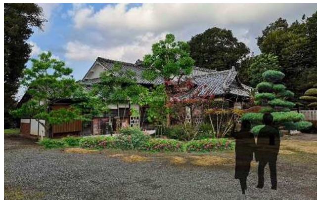
▲ 「(仮称)宮路邸ホテル」イメージ図

麓にゆっくり滞在して頂くことで、宮路邸を起点に人の流れを生み、麓全体の活性化に繋げていきます。さらに、地域の住民の方々と協力して運営することで雇用創出や、地域の方と旅行者との交流を生む拠点として育てていきます。